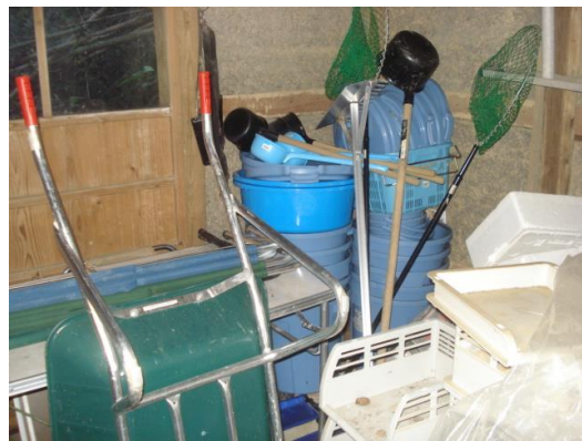
使用した道具類（昨年度事業の購入品）はきれいに洗って、納屋の中に保管しました。