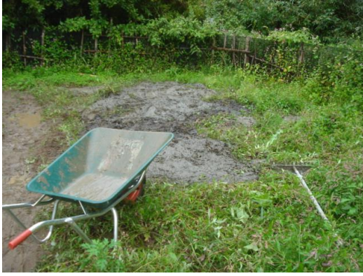
汚泥投入後の畑の様子です。